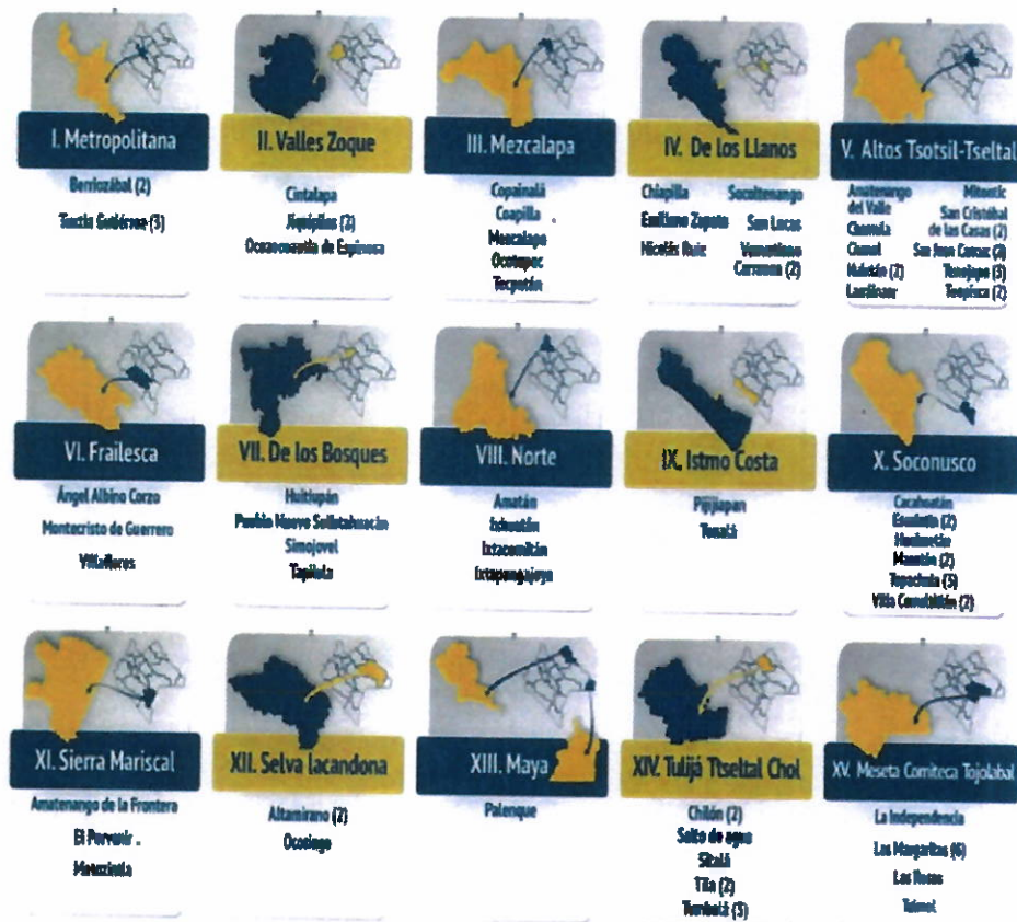
Figura 1. Sedes Universitarias por Región Socioeconómica, 2023