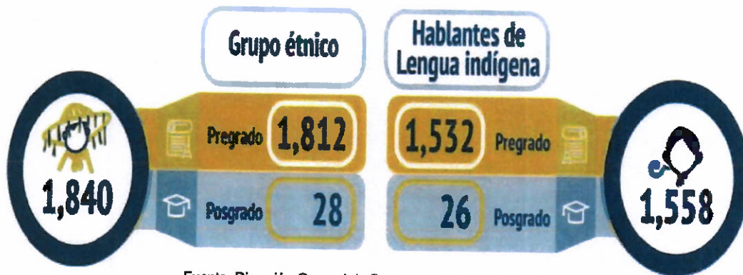
Figura 2. Estudiantes Hablantes de Lengua Indígena o Pertenecientes a algún Grupo Étnico, 2023