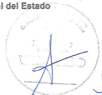
Lic. Omar Fayad Meneses Gobernador Constitucional del Estado de Hidalgo

SEP SES DIRECCIÓN GENERAL DE EDUCACIÓN SUPERIOR UNIVERSITARIA E INTERCULTURAL